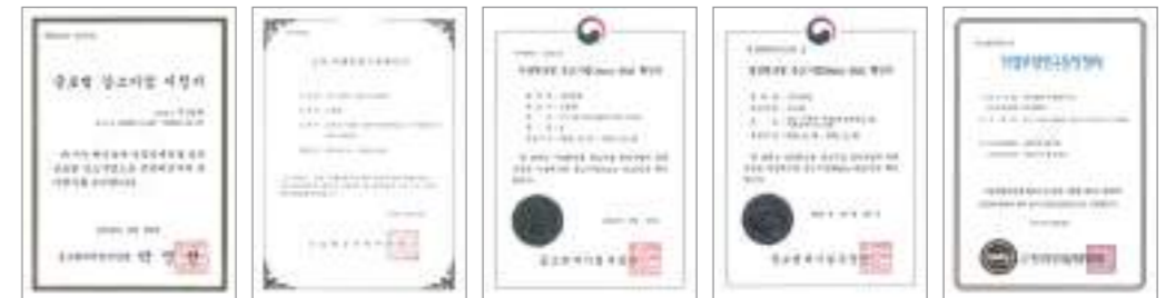
글로벌 강소 기업 지정 [중소벤처 기업부] 소재부품전문기업 확인서 [산업통상자원부] 기술혁신형 중소기업 확인서 (Inno-Biz) 경영혁신형 중소기업 확인서 (Main-Biz) 기업 부설 연구소 지정