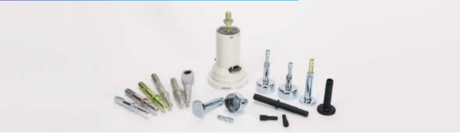
© Output Rod / Adjusting Screw