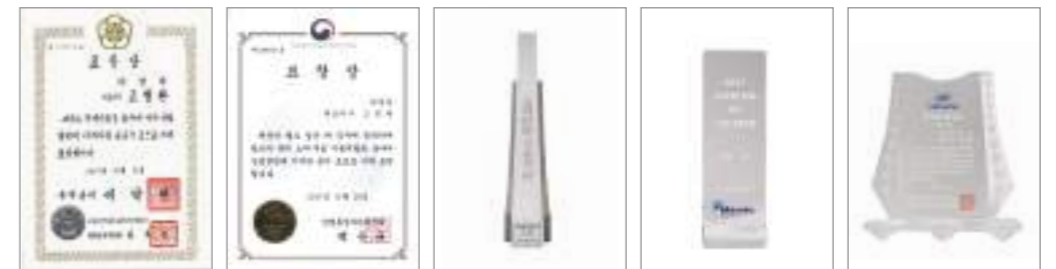
국무 총리 표창 장관 표창 수출 오백만불탑 만도 원가 경쟁력 우수협력사 남양공업 올해의 협력사 대상