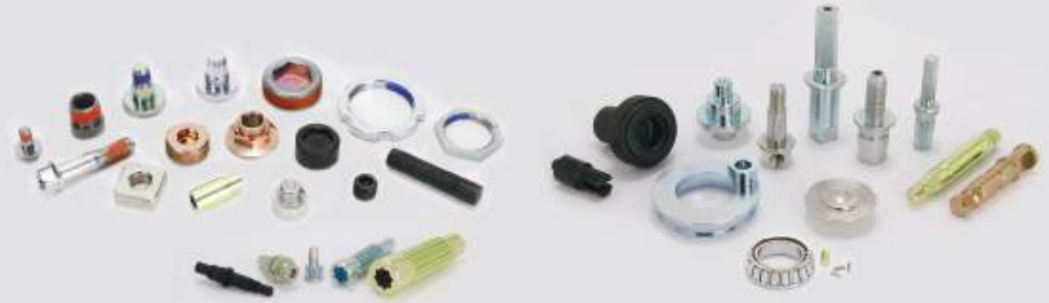
◎ Gear & Tilt Bolt Parts